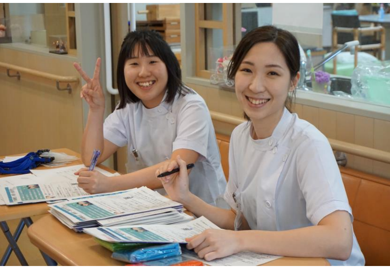
優しいスタッフがお出迎え！