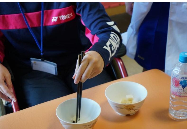
障害・福祉用具体験！