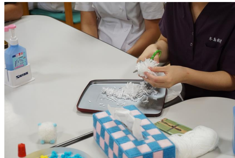
アクティビティ体験！