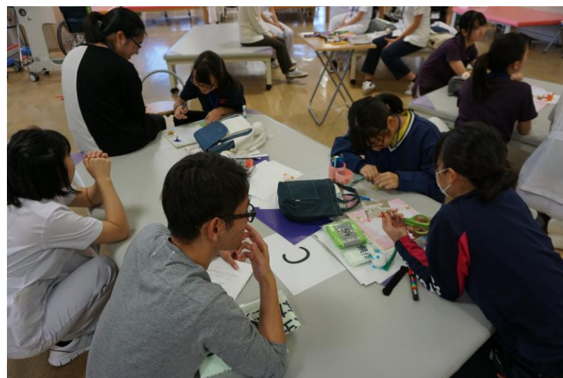
患者さんへ贈る感謝の色紙作り！